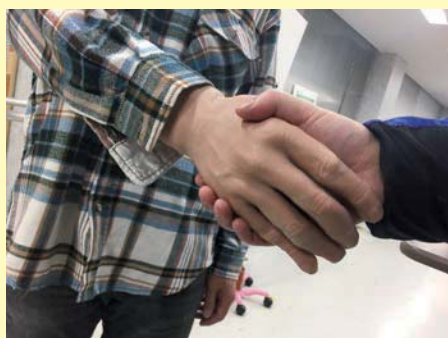
開発中の筋電義手のモデル (写真手前の手)

この採択により開発される筋電義手は、軽量で装飾性に優れるため自然な見た目であるとともに、これを装着することで物体に指を沿わせて掴むことができる。また、量産が可能な構造にすることにより、より多くの義手を必要とする人にとって筋電義手を利用しやすくなることを目的としている。