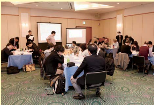
グループワーク研修の様子（滋賀会場）