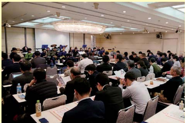
旭川荘ミュージックアカデミーの演奏を鑑賞（岡山会場）