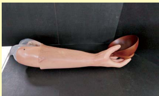
様々な形状に対しても指関節が適切に曲がり、 自然な見た目を持つことが可能