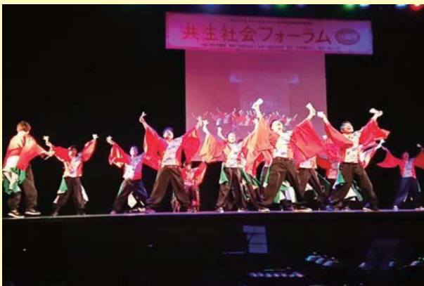
「チームたちばな」によるよさこい踊り（福岡会場）

※2016年7月26日未明、神奈川県相模原市の障害者支援施設「津久井やまゆり園」に元施設職員の男が侵入し、多数の入所者等を刃物で刺し、19人が死亡、26人が負傷した事件。