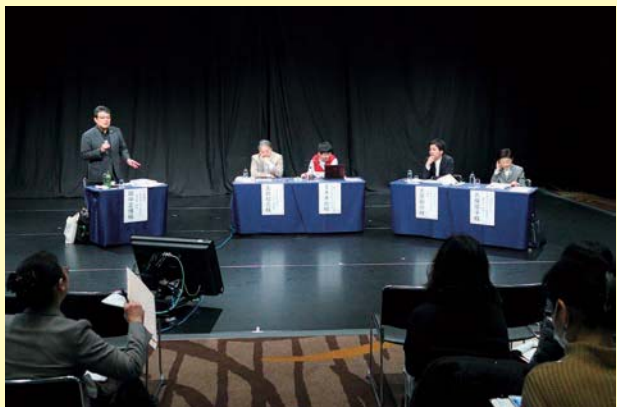
シンポジウム「いのちに意味がある～共生社会フォーラムで何を大切にしてきたのか～」(滋賀会場)