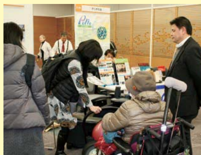
当事者と企業の交流の様子