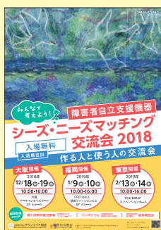
2018年度交流会の チラシ

シーズとニーズのマッチングを図る機会を設けるため、2018年度も東京、大阪、福岡の3会場でマッチング交流会を開催した。ニーズを持つ障害のある人やその支援者と、シーズを持ち開発に取り組む企業や研究者などが集まり、「こんな支援機器があるといいな」といった支援機器に求める機能についてや、「こんな機器の開発をしているが操作性はどうか」といった企業等の開発技術に関してなど、様々な立場の方による意見交換がなされた。また、企業や障害者団体などによるブース出展のほか、支援機器に関するシンポジウムや開発助成の成果報告会も行われ、開発中の機器を実際に用いてアドバイスが行われるなど交流が深められた。